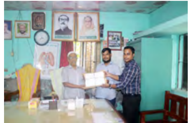
প্রত্যক্ষদর্শী ভাষ্য প্রদান করেন বলাখাল চন্দ্রবান বালিকা উচ্চ বিদ্যালয়ের প্রধান শিক্ষক ও নেটওয়ার্ক শিক্ষক

রূপসা জমিদার বাড়ি : প্রায় ২৫০ বছরের পুরনো রূপসা জমিদার বাড়ি। এটি চাঁদপুর জেলার ফরিদগঞ্জ উপজেলার রূপসা গ্রামে অবস্থিত। জমিদার বাড়িতে তিনটি আলাদা আলাদা ভবন রয়েছে। এছাড়াও রয়েছে পুকুরঘাট, সবুজ মাঠ, টিনের তৈরি ঘর, মসজিদ ও কবরস্থান। জমিদার বাড়ির বংশধরেরা এখনো এই বাড়িতে বসবাস করছে এবং বাড়িটি এখনো প্রায় আগের মতোই রয়েছে।