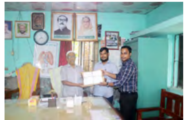
প্রত্যক্ষদর্শী ভাষ্য প্রদান করেন বলাখাল চন্দ্রবান বালিকা উচ্চ বিদ্যালয়ের প্রধান শিক্ষক ও নেটওয়ার্ক শিক্ষক

রূপসা জমিদার বাড়ি : প্রায় ২৫০ বছরের পুরনো রূপসা জমিদার বাড়ি। এটি চাঁদপুর জেলার ফরিদগঞ্জ উপজেলার রূপসা গ্রামে অবস্থিত। জমিদার বাড়িতে তিনটি আলাদা আলাদা ভবন রয়েছে। এছাড়াও রয়েছে পুকুরঘাট, সবুজ মাঠ, টিনের তৈরি ঘর, মসজিদ ও কবরস্থান। জমিদার বাড়ির বংশধরেরা এখনো এই বাড়িতে বসবাস করছে এবং বাড়িটি এখনো প্রায় আগের মতোই রয়েছে।