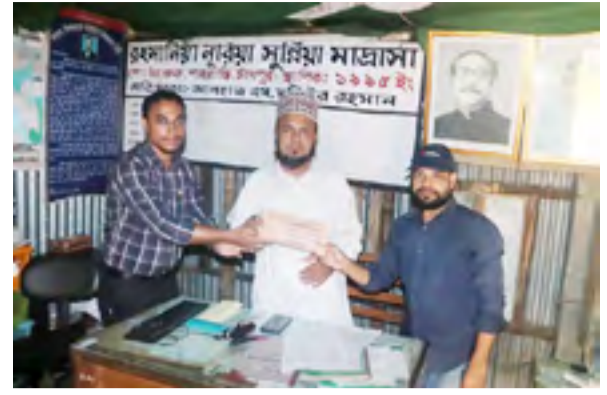
প্রত্যক্ষদর্শী ভাষ্য প্রদান করেন রহমানীয়া নুরিয়া সুল্লিয়া মাদ্রাসার সুপার ও নেটওয়ার্ক শিক্ষক