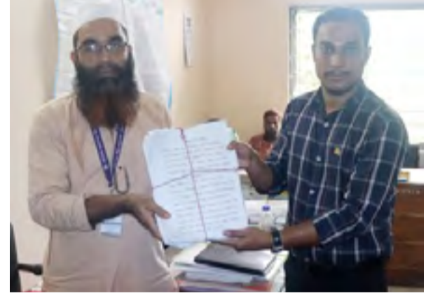
প্রত্যক্ষদর্শী ভাষ্য প্রদান করেন ওয়ারুক রহমানীয়া উচ্চ বিদ্যালয়ের নেটওয়ার্ক শিক্ষক

চাঁদপুর জেলা জুড়ে এবং শহরের আশপাশে ১৯টি বধ্যভূমি রয়েছে। এসব বধ্যভূমিগুলোর অনেকগুলোতেই স্মৃতিসৌধ নির্মিত হয়নি। তারমধ্যে কয়েকটি হলো: রক্তধারা বধ্যভূমি, অঙ্গীকার বধ্যভূমি, মুক্তিসৌধ বধ্যভূমি, ছোটসুন্দর বধ্যভূমি, বাগাদি বধ্যভূমি, গৃদকালিন্দিয়া বধ্যভূমি, রহমানগর বধ্যভূমি, এবং রসুলপুর বধ্যভূমি ইত্যাদি। যে সকল শিক্ষা প্রতিষ্ঠানে ভ্রাম্যমাণ মুক্তিযুদ্ধ জাদুঘরের শিক্ষা কর্মসূচি বাস্তবায়ন করা হয়েছে সেগুলো হলো- গভ. টেকনিক্যাল হাই স্কুল, মহামায়া হানাফিয়া উচ্চ বিদ্যালয়, বলাখাল চন্দ্রবান বালিকা উচ্চ বিদ্যালয়, কৃষ্ণপুর ঘোহরা বালিকা উচ্চ বিদ্যালয়, বলাখাল যোগেন্দ্র নারায়ণ উচ্চ বিদ্যালয় ও কারিগারি কলেজ, বাগাদি গণি উচ্চ বিদ্যালয়, বাগাদি আহম্মদিয়া ফাযিল ডিগ্রি মাদ্রাসা, ধানুয়া ছালেহিয়া